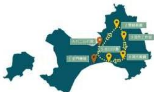
圖 5-1 本專題之旅遊地圖 資料來源：本研究整理

這趟旅程不僅體驗了多樣的活動，還深刻感受到環保意識的重要性，讓旅行成為一段綠色、可持續的回憶，不僅是一場冒險更是一場對生活豐盈和低碳永續的探索。如圖 5-1 「本專題之旅遊過程」