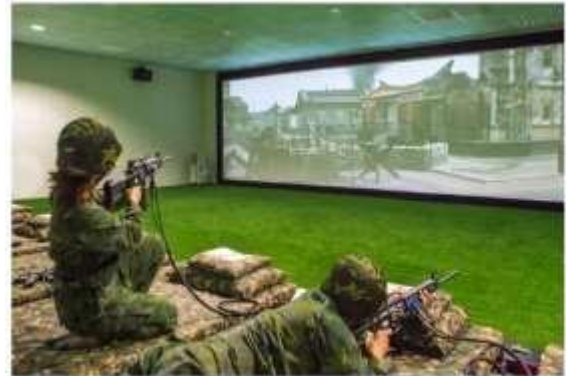
圖 1-1 后麟模擬靶場

本次遊程之規劃天數是三天兩夜以配合大家日常生活作息，另外，考慮藍眼淚的季節因此建議可以選擇於四到五月出團，因為該月適逢每年春天到夏天交接的季節，當時的天候情況正逢藍眼淚的好發時期，可以讓到訪遊客參觀到這個曾經被列為世