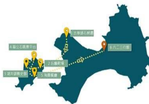
圖 5-2 本專題之旅遊地圖

終於到了晚餐時光，走進海園餐廳就聞到散發著芋頭香氣，每一口美食都擁有當地獨特風味，嘴裡散發著濃郁的芋頭風味，成為整個旅途中一個溫馨的收穫。最後回到八二三行館，心靈驛站再出發，不僅與大自然親密接觸，品味了當地美食還挑戰了各種活動，留下了豐富的回憶。如圖 5-2 「本專題之旅遊過程」