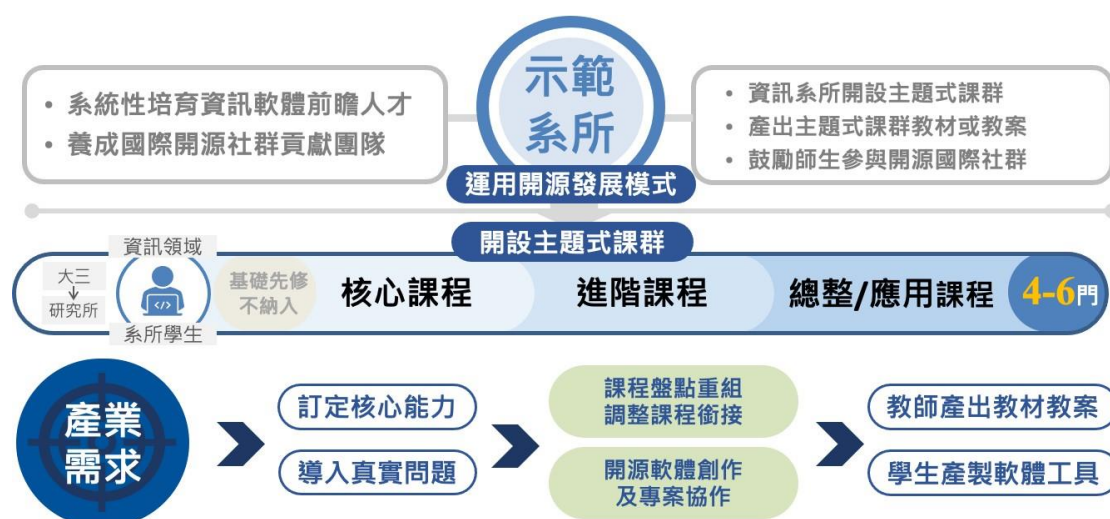
圖 5. 開源軟體創作前瞻人才培育示範系所