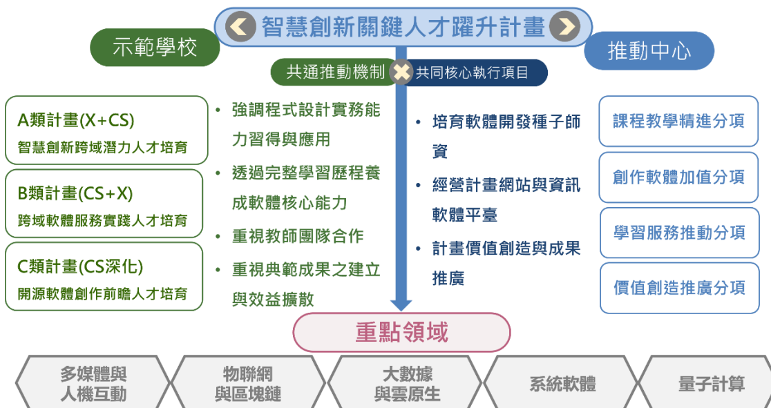
圖 1. 智慧創新關鍵人才躍升計畫推動架構