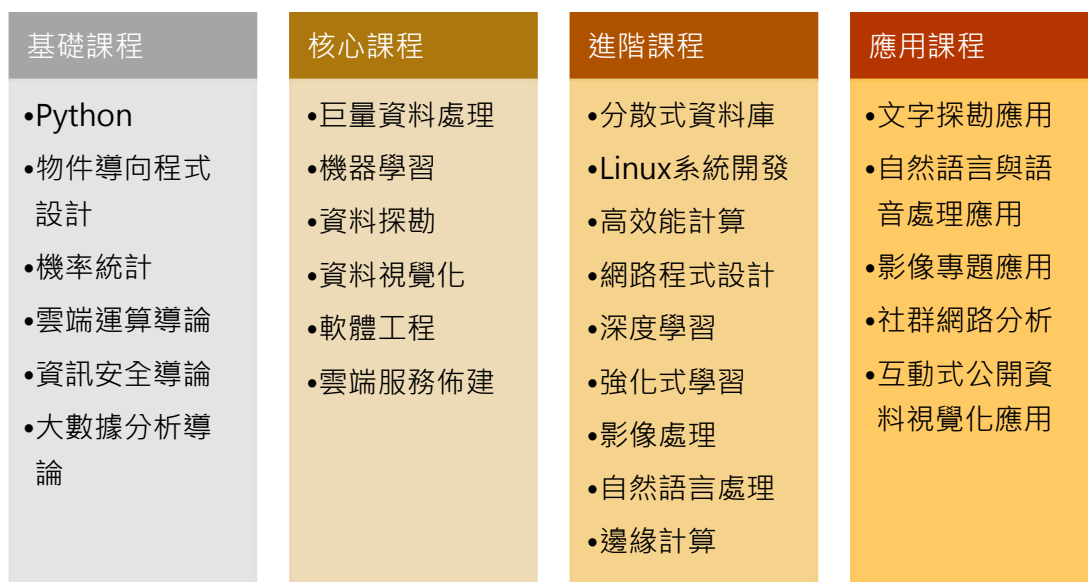
圖 8. 大數據與雲原生領域知識地圖