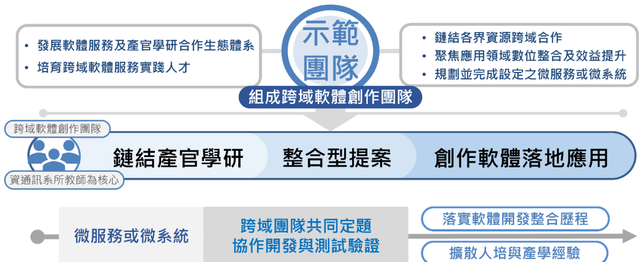
圖 4. 跨域軟體服務實踐人才培育示範團隊