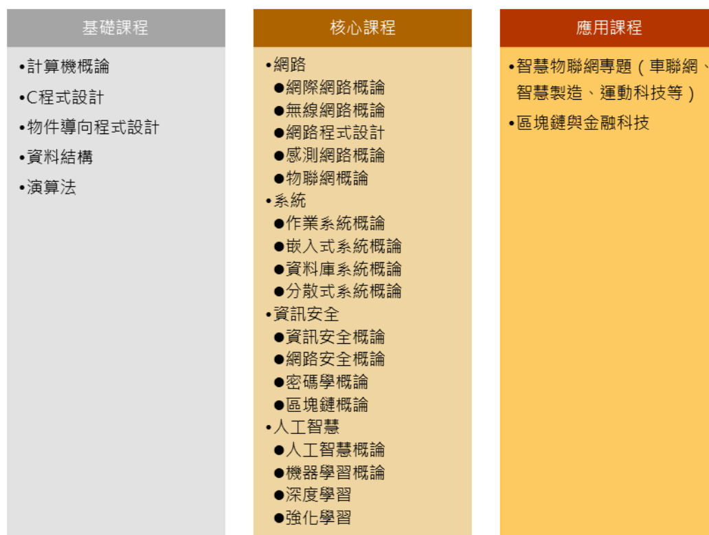
圖 7. 物聯網與區塊鏈領域知識地圖

等，也可以介紹區塊鏈與物聯網系統在智慧製造環境（如生產履歷與物流）上的應用以及目前的發展趨勢。